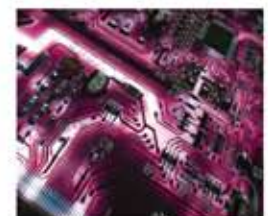
DSP (processador de som digital)