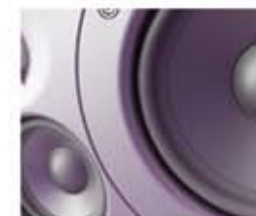
Altifalante específico de alto rendimento